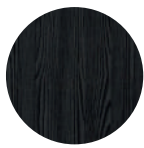
Fresno negro Black Ash